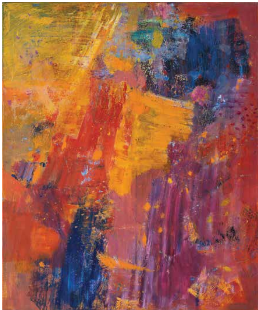
Iz cikla JESENSKI NOCTURNO, 2023, akril pl., 120 × 100 cm