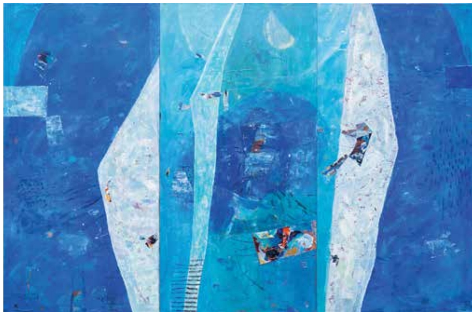
TRIPTIH TINSKO, 2019, akril, kolaž pl., 140 × 210 cm