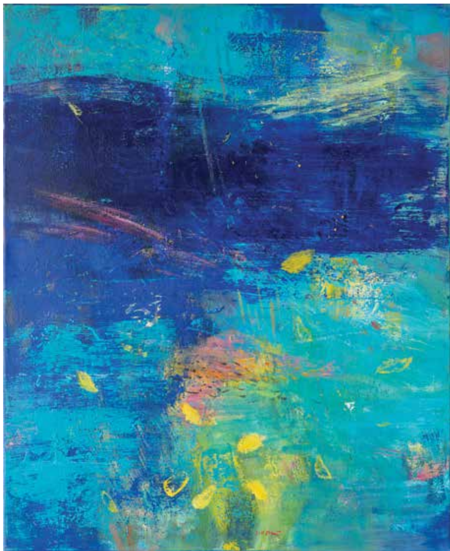
Iz cikla DOTIK POLETJA 3, 2022, akril pl., 100 × 80 cm