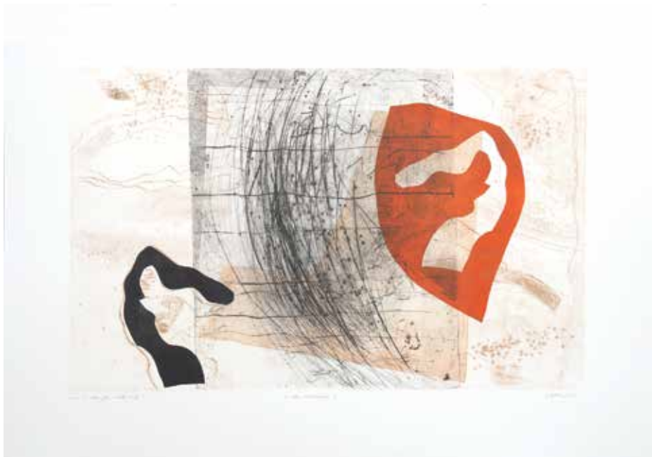
Iz cikla NOCTURNO 8, 2023, suha igla, visoki tisk, 70 x 100 cm (49,3 × 78,7 cm)