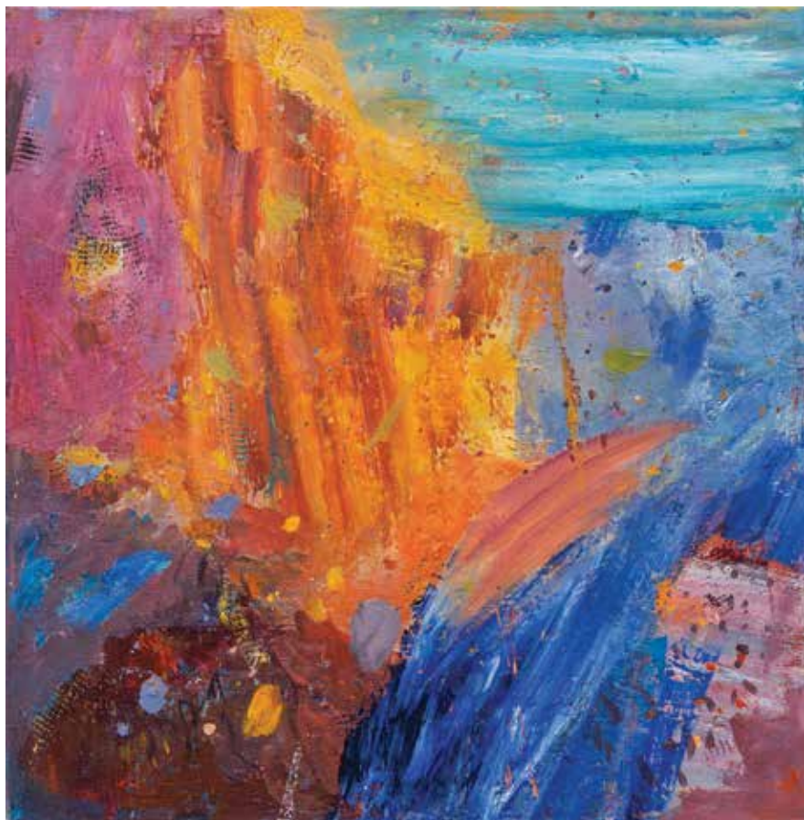
Iz cikla JESENSKI NOCTURNO, 2023, akril pl., 80 × 80 cm