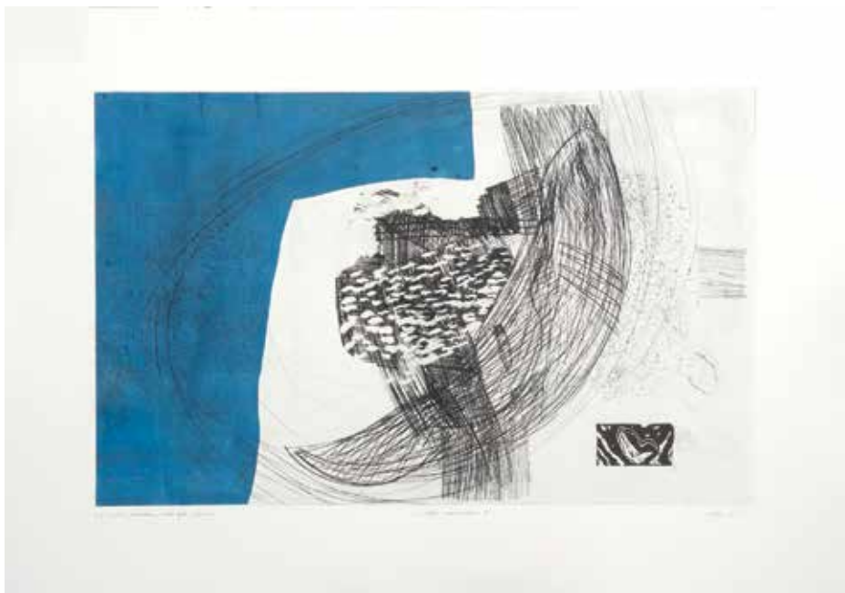
Iz cikla NOCTURNO 9, 2023, jedkanica, suha igla, linorez, 70 x 100 cm (49,3 × 78,7 cm)