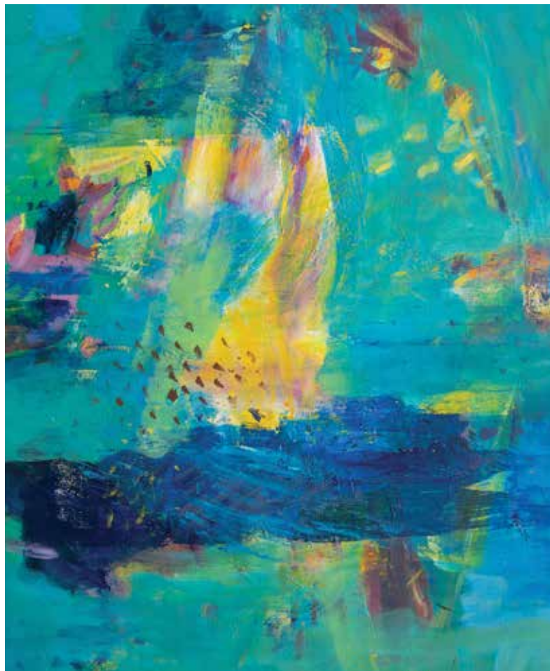
Iz cikla DOTIK POLETJA 1, 2022, akril pl., 100 × 80 cm