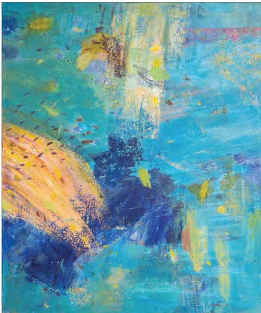
Iz cikla POLETNI NOCTURNO, 2023, akril pl., 120 × 100 cm