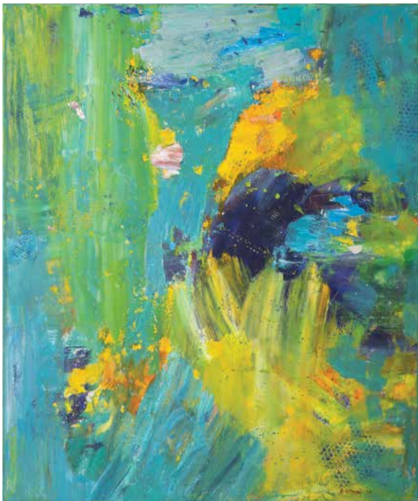
Iz cikla POMLADNI NOCTURNO, 2023,akril pl., 120 × 100 cm