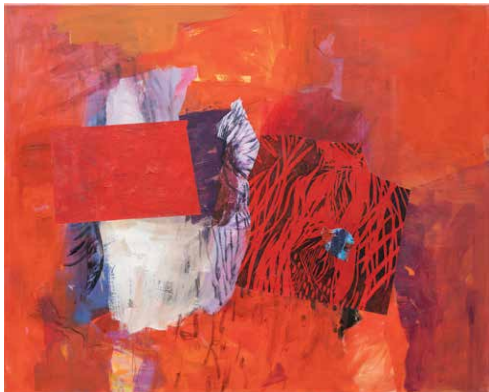
Iz cikla PLES V RDEČEM, 2022, akril, kolaž pl., 80 × 100 cm