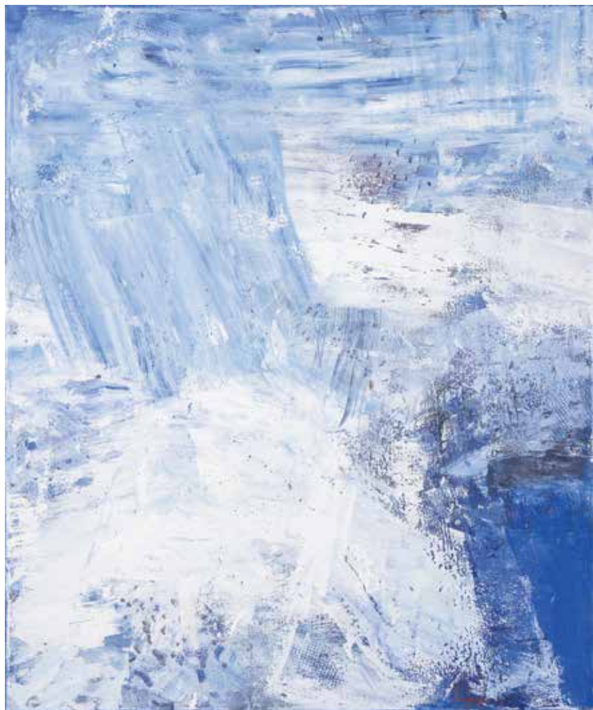
Iz cikla ZIMSKI NOCTURNO, 2023, akril pl., 120 × 100 cm