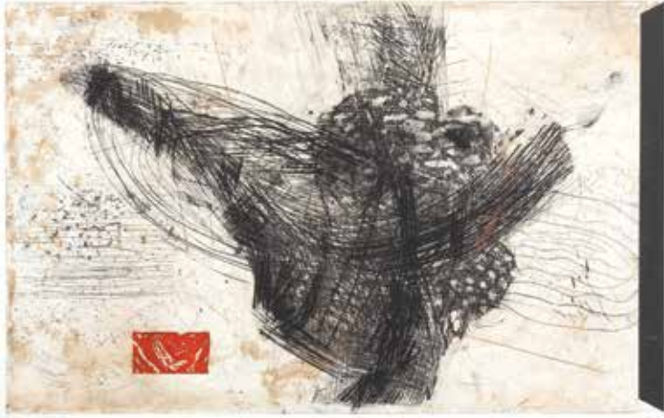
Iz cikla NOCTURNO 10, 2023, jedkanica, suha igla, linorez, 70 x 100 cm (49,3 × 78,7 cm)