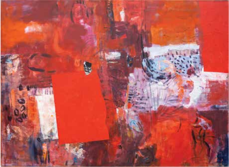
Iz cikla PLES V RDEČEM, 2020/22, akril, kolaž pl., 100 × 140 cm