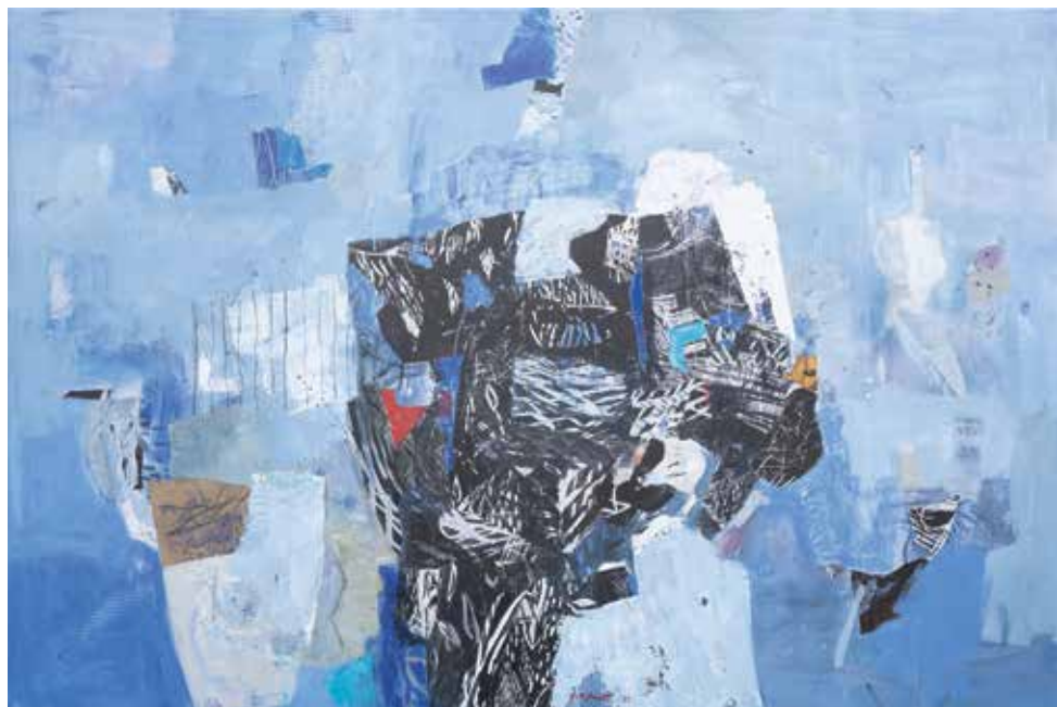
Iz cikla PREBUJENJE 2, 2023, akril, kolaž pl., 100 × 150 cm