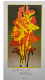
Del akvarelov iz galerijske zbirke