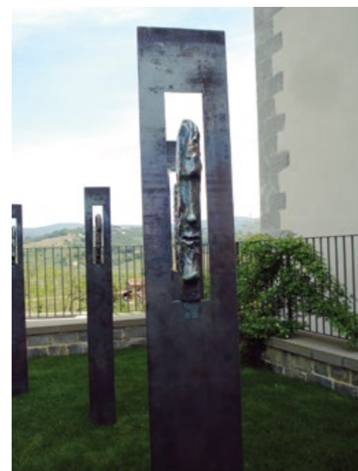
Ujetniki, 2017, raku, metal, 20 x 200 cm