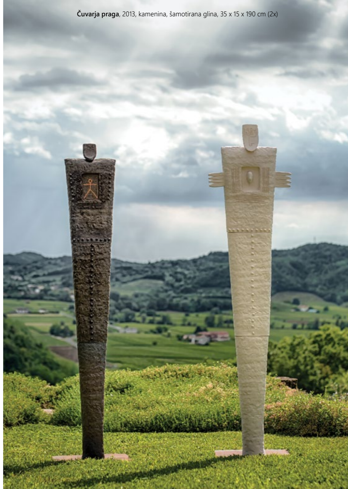
Čuvarja praga, 2013, kamenina, šamotirana glina, 35 x 15 x 190 cm (2x)

njih pa postavi figuro Čuvaja, ki spominja na Rodinovega Misleca. Figure se vrtijo v krogu, v peklu svojih misli. Ne vedo, da svoboda, po kateri hrepenijo, ni dosegljiva z razumom.