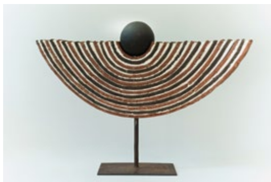
Feniks , 2012, šamotirana glina, metal, 64 x 8 x 56 cm