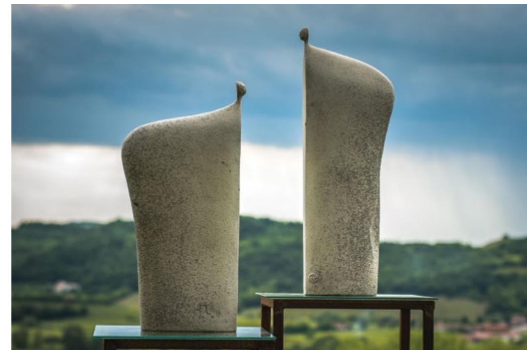
Sfinigi, 2009, raku, 33 x 12 x 65 cm, 25 x 10 x 73 cm