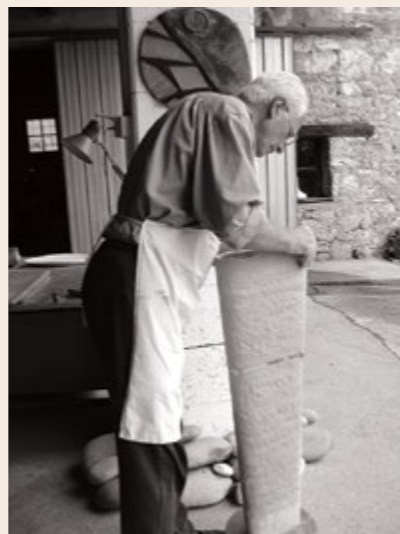
Prva stran Anima , 2009, šamotirana glina, 25 x 25 x 60 cm