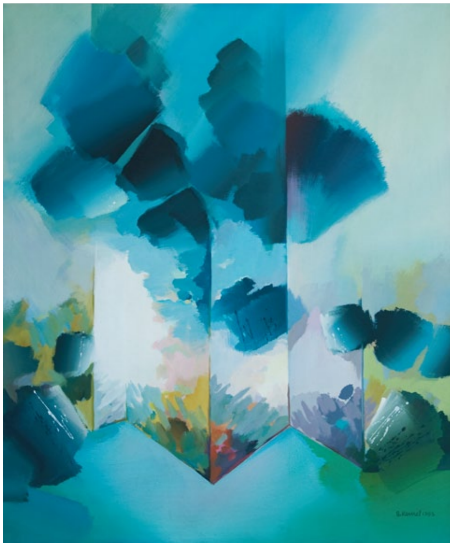
Kozmično vzdušje / 1983 / 120 x 100 cm

Slika na naslovnici: Nenaklonjeno okolje / 1980 / 100 x 150 cm